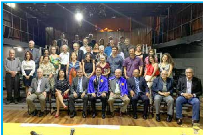
Participantes da posse de Imortal da Academia Brasileira de Educação Física