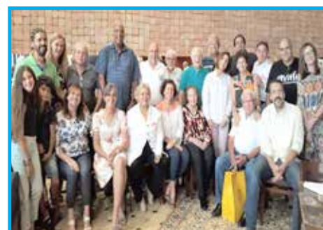
Participantes da confraternização de dezembro