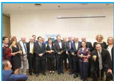
Panathletas de todos os países receberam Medalha de 20 anos do CREF4/SP