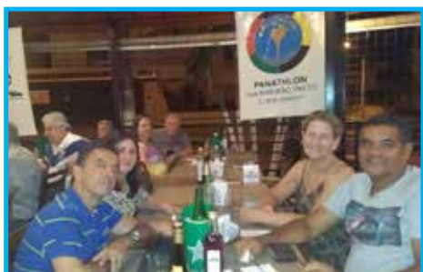
Convívio do mês de outubro no Restaurante Latulia