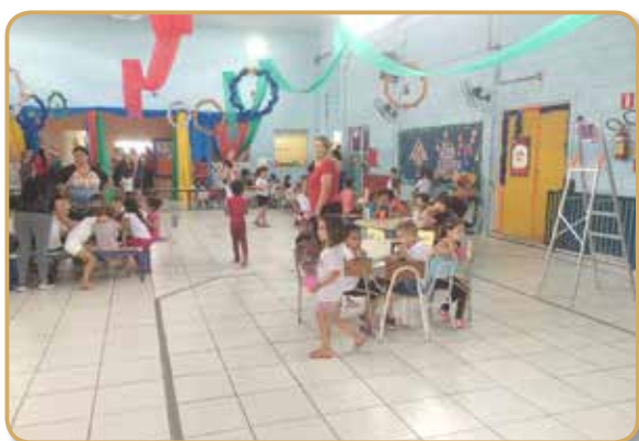
Pátio da escola, local do evento