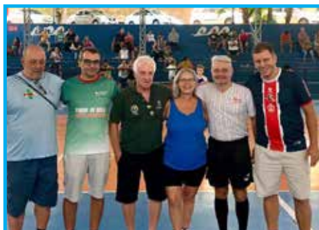
Panathletas presentes na 7ª Copa Toque de Bola de Futsal