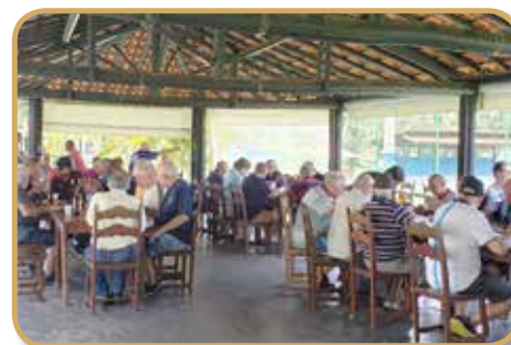
Momento do almoço de confraternização