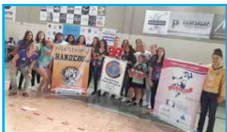
Final da Liga de Handebol, categoria adulto, no ginásio Russão