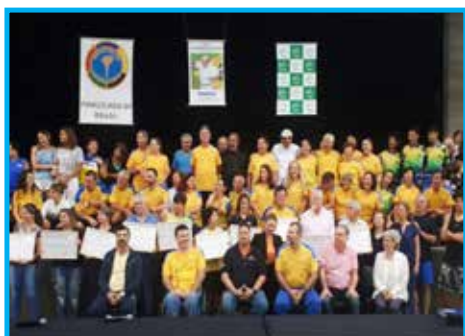
Participantes da comemoração do Dia do Quimbol