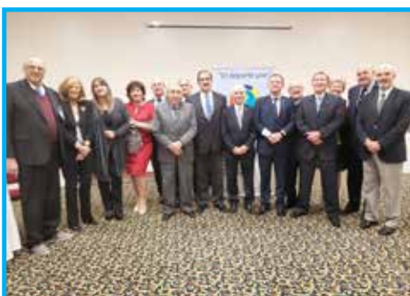
Membros do Panathlon Club Buenos Aires, organizadores do congresso