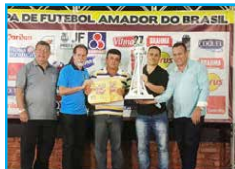
Equipe Rezato/Master recebendo o Fair Play da Copa Prefeitura Bahamas de Futebol Amador