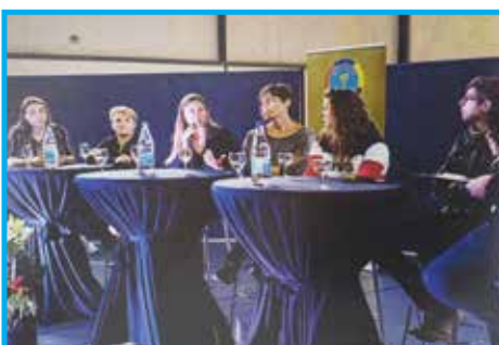
Panathlon Clube Flandres – Bélgica. Protagonismo da Mulher no Esporte