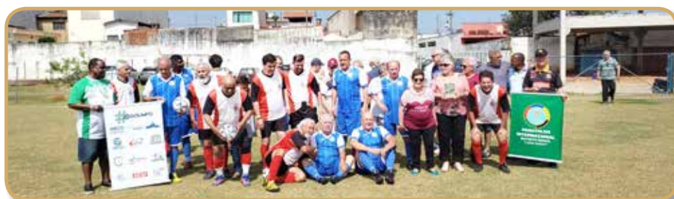
Participantes do 20º Encontro de Gerações do Futebol no Humberto Reale