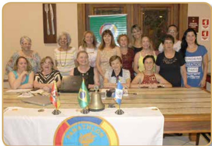
Participação feminina no convívio de outubro

Como tradicionalmente ocorre, o convívio foi encerrado com um jantar por adesão reunindo todos os panathletas e convidados.