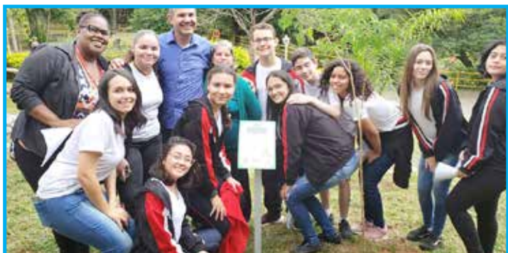
Alunos do Sesi participaram do plantio das árvores no Bosque da Fama