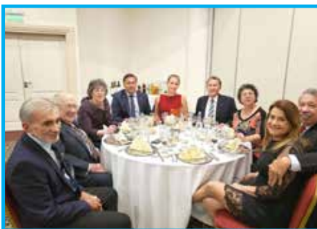
Panathletas do Brasil, Argentina, Bélgica e Itália