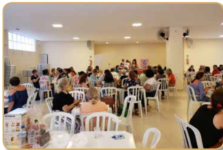
Salão de eventos da Igreja Sagrada Família