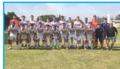
Equipe do São Paulo FC jogou contra Nigéria na preparação para mundial Sub 17