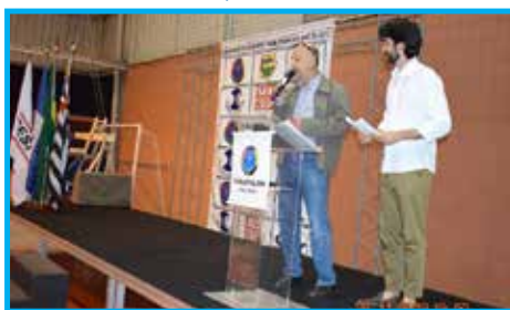
Abertura da premiação Melhores do Ano no Esporte com o presidente Wiliam Saad