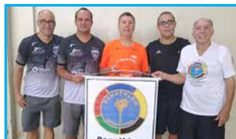
Panathletas na final da 2ª Copa das Escolinhas de Futsal 2019