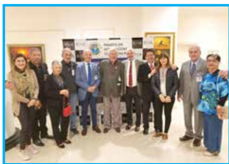
Delegação brasileira com os presidentes Pierre Zappelli e Rubén Lamas