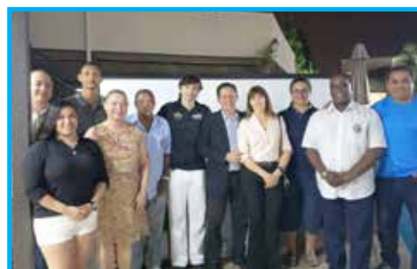
Panathletas presentes no evento em Sorocaba