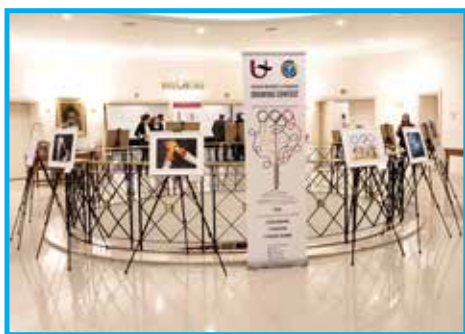
Exposição do Concurso de Desenho da Universidade de Antuérpia (Bélgica) e do Panathlon