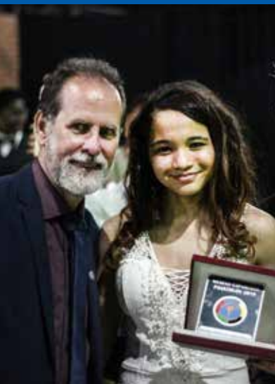
Prêmio Panathlon Juiz de Fora