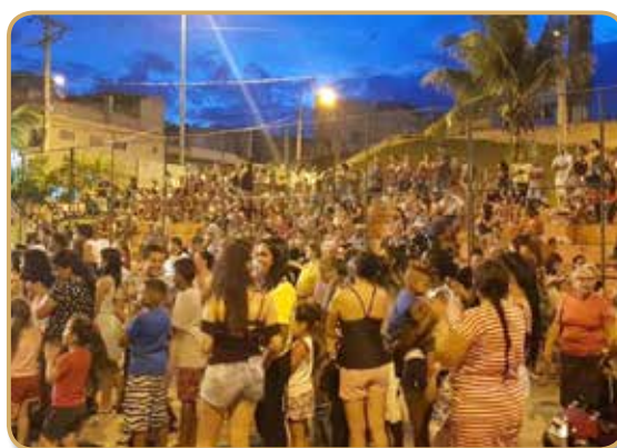
Bairro dos Morros, Vila Sabiá e Colorau comemoram chegada do Papai Noel