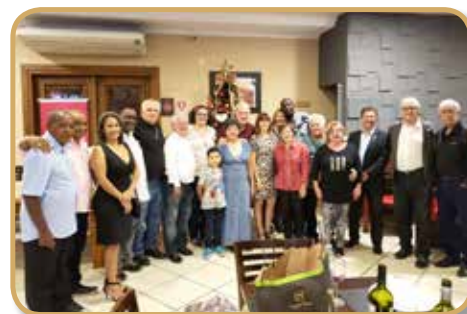
Panathletas de Sorocaba e Votorantim posaram para foto