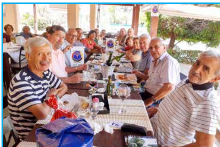
Clube Círculo Militar de Recife é o local de encontro do Panathlon