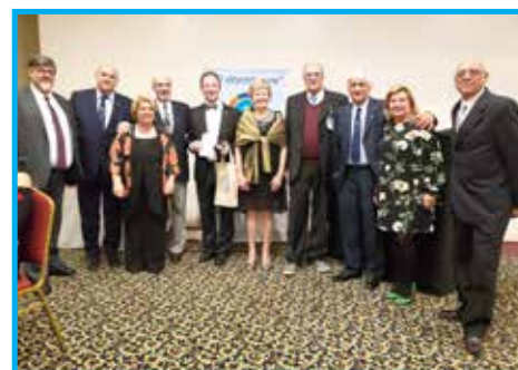
Organizadores do evento com delegação do Uruguai