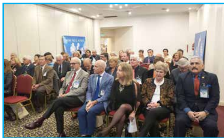
Auditório lotado com a presença de panathletas e autoridades