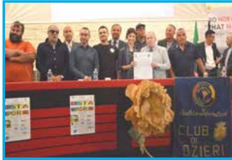
Panathlon Club Ozieri – Itália. Festa dos Esportes, Prêmio Panathlon