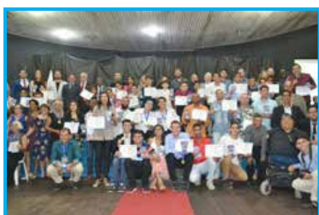
Homenageados da 2ª Festa do Esporte