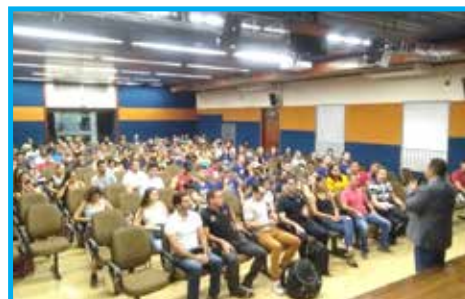
Público presente no Viva EF em Rio Claro