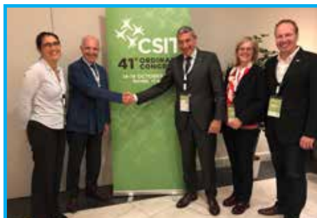
Parceria entre Federação Internacional de Medicina Desportiva (FIMS) e o Panathlon Internacional