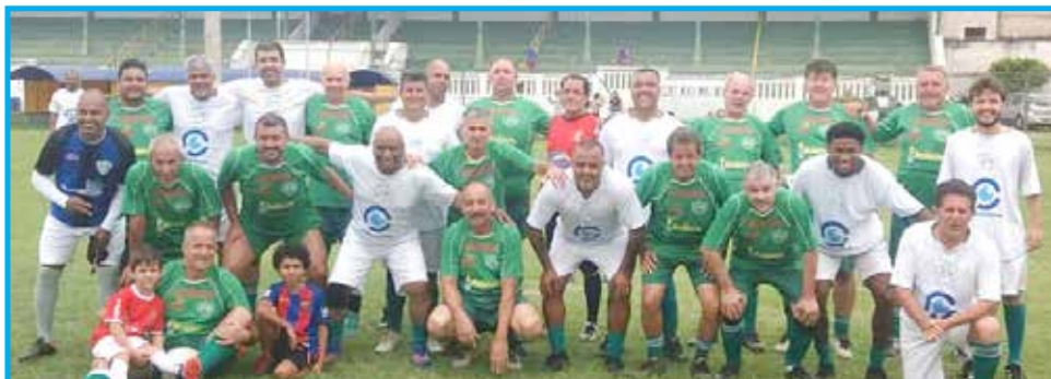
Equipes: Preto (camisa branca) e Branco (camisa verde)