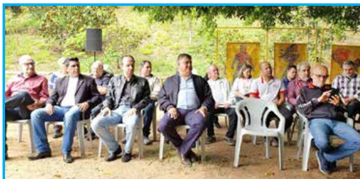
Autoridades na abertura do Bosque da Fama do Panathlon Votorantim