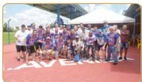
Equipe do Avenida, campeã amadora em 2002