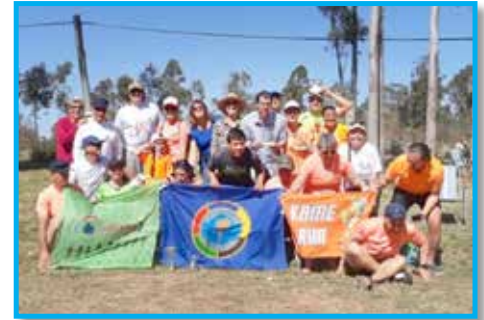
Panathlon Club Maldonado Punta Del Este – Uruguai