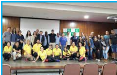
Homenageados do Conselho Regional de Educação Física