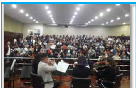
Apresentação da Orquestra Hugo Belézia

A orquestra da Escola de Música Hugo Belézia abrilhantou a noite com a execução do Hino Nacional Brasileiro e com apresentações musicais de seu repertório.