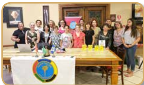
Participação feminina no convívio de novembro