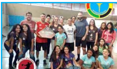
Equipe vencedora do Troféu Fair Play da Liga de Handebol