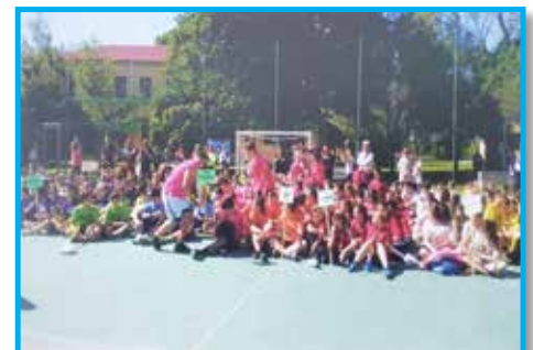
Panathlon Veneza – Itália. 18 escolas participaram da 9ª Edição das Panathlidas