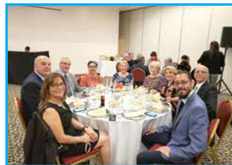
Argentinos, brasileiros, uruguaios e mexicanos