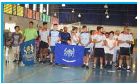
XVI Paralimpíadas de Taubaté