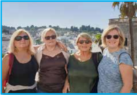
Equipe de apoio do Panathlon Internacional no evento em Molfeta – Itália