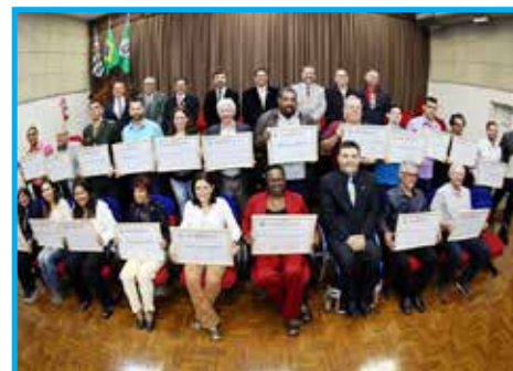
Homenageados e autoridades do Dia do Panathleta e do Profissional de Educação Física