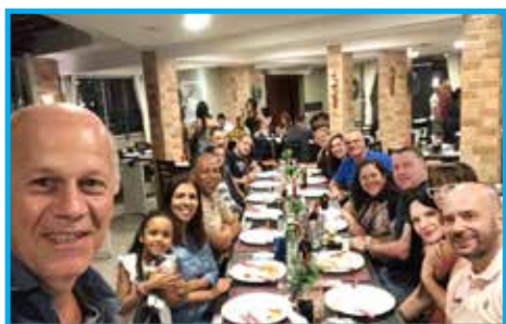
Convívio do mês de dezembro no Restaurante Spontanea em Praia Grande

Encerrando as atividades de 2019, o clube realizou no dia 4 de dezembro a confraternização de fim de ano no restaurante Spontanea, com a presença dos panathletas e familiares, fortalecendo os laços de amizade do esporte e da educação física.