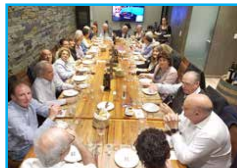
Almoço de encerramento no Restaurante Elauge – Buenos Aires