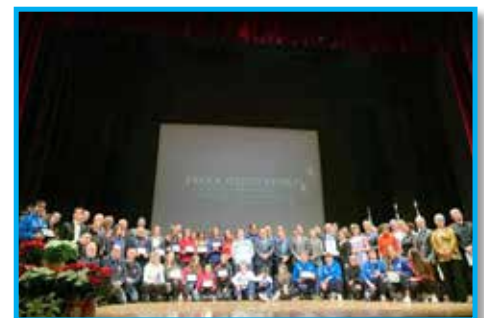
Festa do Esporte, Premiação do CONI com apoio do Panathlon Club Biella – Itália