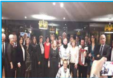
Panathlon Club Agrigento – Itália, confraternização de Natal