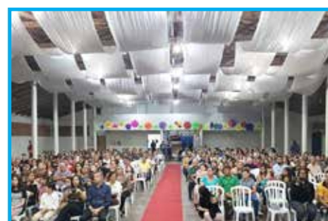
Centro de Convenções “Carlos Farrapo” com lotação máxima