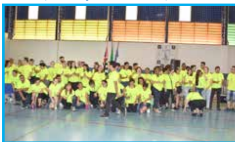
Atletas participantes da XVI Paralimpíadas de Taubaté