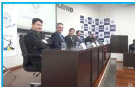
Mesa das autoridades