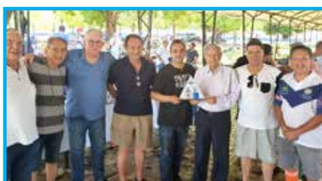
Membros da Equipe da Loja Maçônica Perseverança III