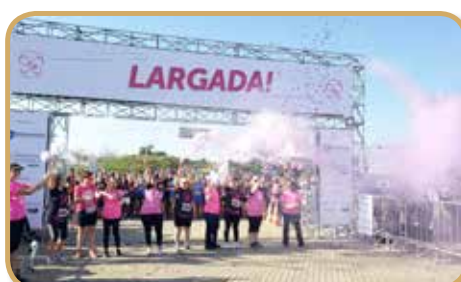
Assistidas da Liga no momento da largada