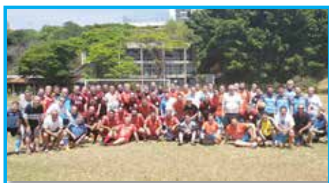
Abertura do evento no campo do Sesi Votorantim