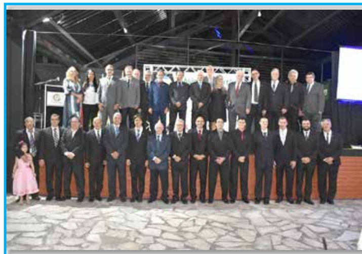
Panathletas e autoridades