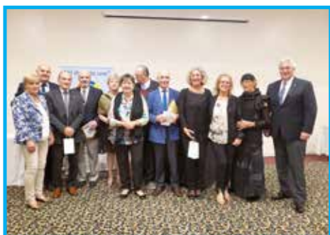
Organizadores do evento com delegação italiana