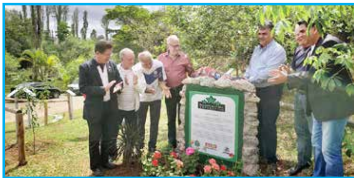
Homenagem ao Esporte Clube Savoia, primeiro clube de futebol do Brasil