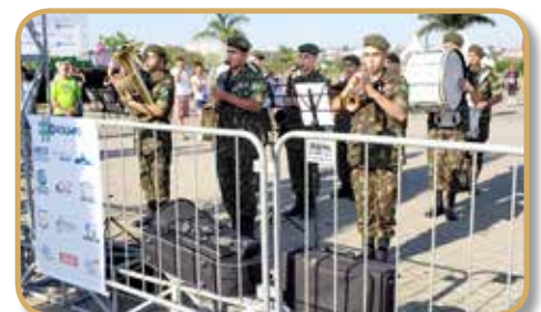
Banda do Exército na execução do Hino Nacional