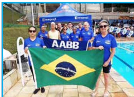
Desfile de abertura da II Copa Juiz de Fora de Natação

Finalizando o ano com a premiação da Taça Disciplina Panathlon Club Juiz de Fora na Copa Prefeitura Bahamas de Futebol Amador 2019, um dos maiores do Brasil, para equipe da Estação São Pedro.