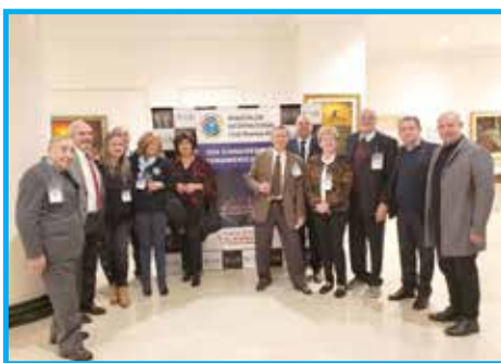
Membros do Panathlon Club Buenos Aires, organizadores do evento