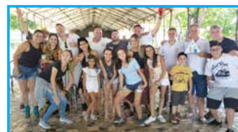
Loja Maçônica XXVII de Março de Votorantim, campeã do Truco