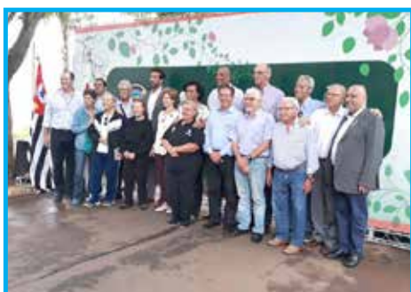
Autoridades, panathletas e homenageados no Bosque da Fama