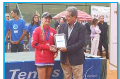
Reggio Calabria – Itália. Prêmio Panathlon Fair Play no Tênis Europeu Júnior Master