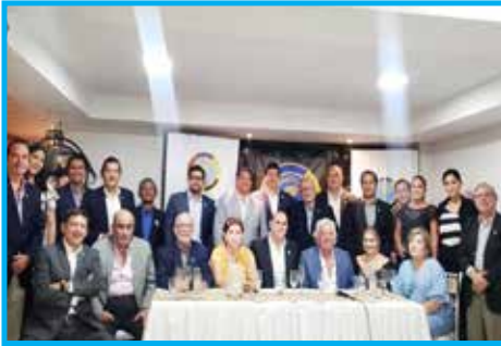
Fundação do Panathlon Portoviejo Distrito Equador