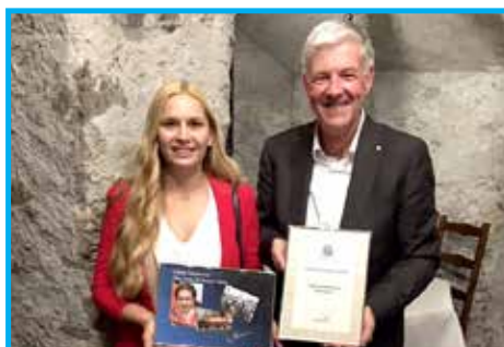
Panathlon Club Liechtenstein – Áustria, concedeu o Prêmio de Promoção Esportiva