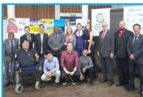
Panathletas e convidados