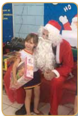
Papai Noel entregando os presentes