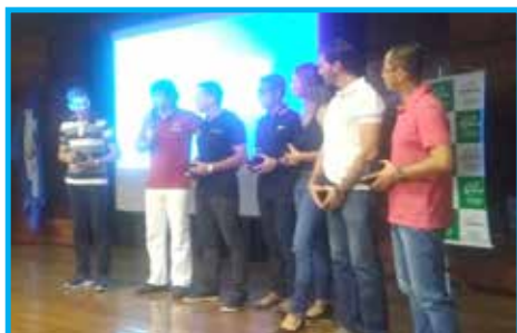
Momento da escolha do Melhor Personal Trainer da região sudeste do Brasil em Rio Claro