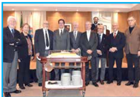
Panathlon Club Lisboa – Portugal, comemorou em dezembro 40 anos de fundação