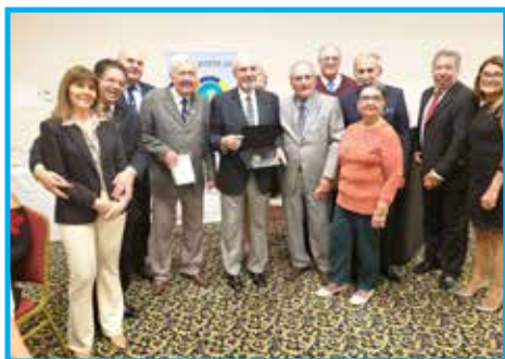
Delegação brasileira com organizadores