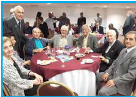
Panathletas de São Paulo