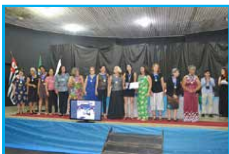
Equipe da Terceira idade