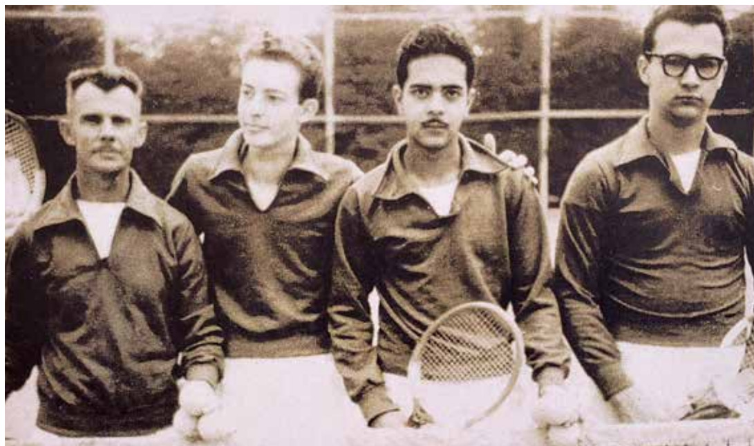
Livro História do Esporte de Sorocaba