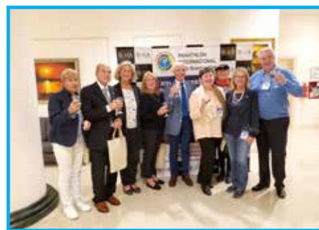
Delegação da Itália com o presidente Pierre Zappelli