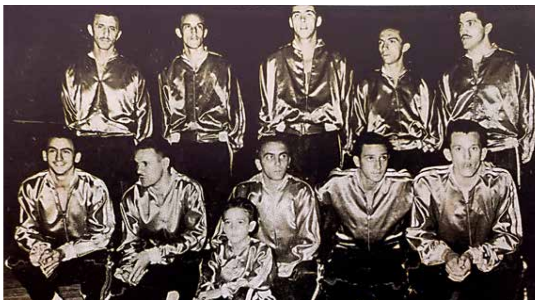
Livro História do Esporte de Sorocaba