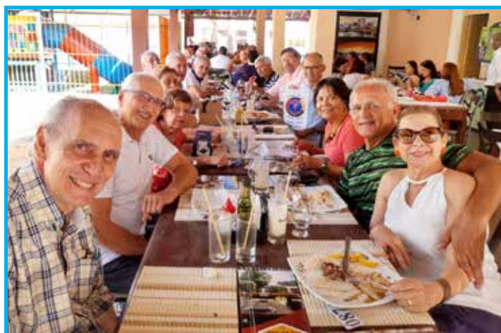
Panathletas no convívio comemorativo de 40 anos de fundação do clube