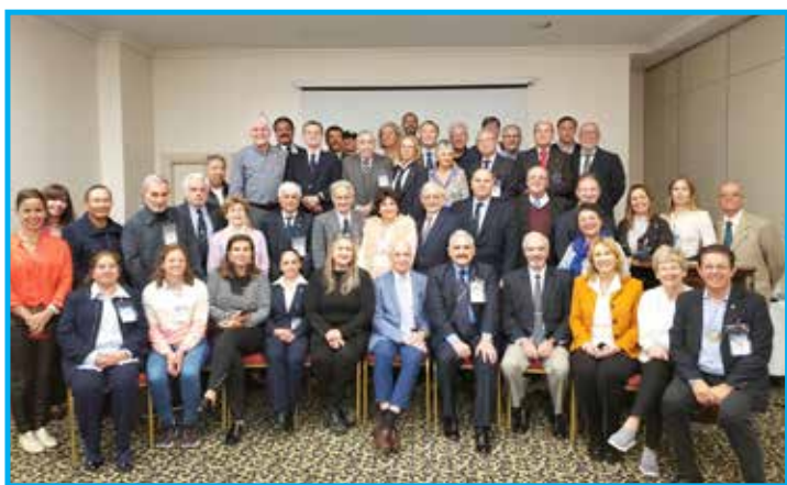
Participantes do Congresso Pan-Americano