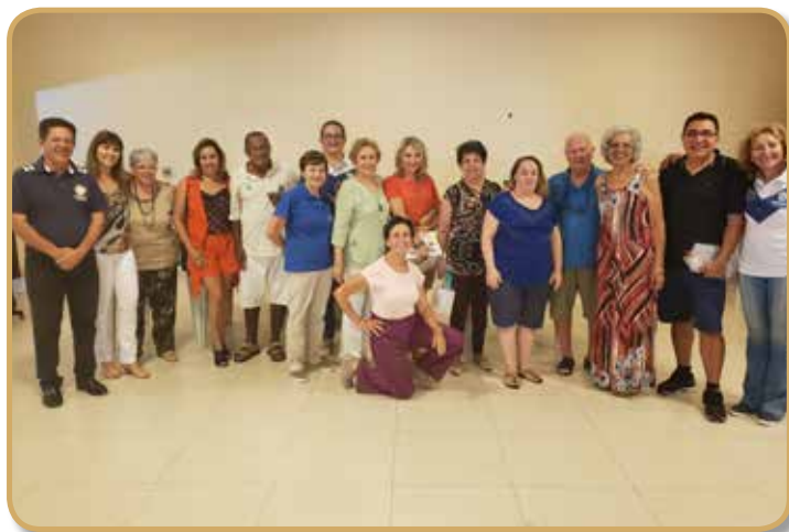
Panathletas presentes no evento

Toda a renda do encontro foi destinada à compra de brinquedos para a realização do Natal Feliz do Panathlon, que há 22 anos atende às 165 crianças da Creche Sônia Aparecida Machado, no bairro dos Morros, e do Natal da Associação de Moradores da Vila Sabiá, João Romão e Colorau, e há três anos vem contribuindo com a festa da Associação Criança Feliz, da Vila Haro.