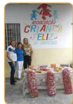
Natal na Associação Criança Feliz