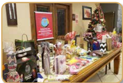
Brindes para sorteio entre os presentes

em uma reunião oficial, da saudação ao pavilhão nacional e execução do hino do Panathlon. O jantar contou com a presença da família Panathlon, visto que todos os sócios compareceram acompanhados dos cônjuges e filhos.