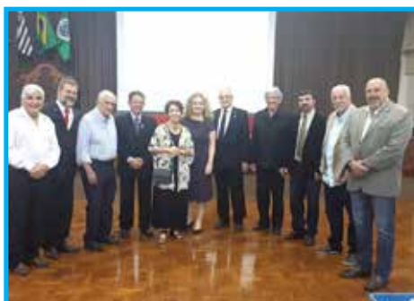
Panathletas e autoridades na Sessão Solene em comemoração aos 30 anos do PDB