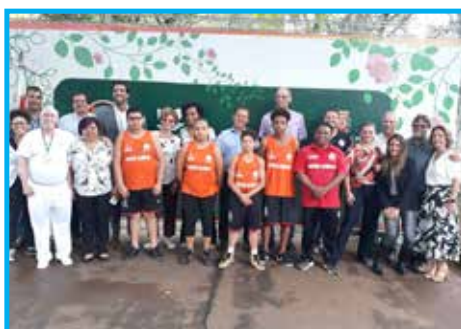
Atletas, técnicos e dirigentes do Centro Olímpico com autoridades e homenageados