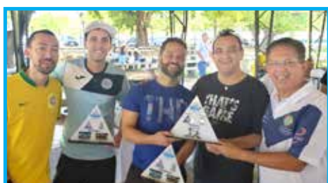
Troféu Fair Play para as Lojas Rafael Tobias Aguiar, Jaques Demolay e XXVI de Maio