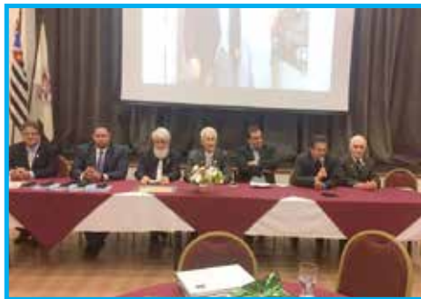
Mesa principal com autoridades no convívio de novembro