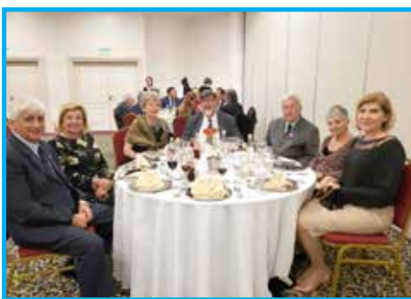
Panathletas do Uruguai, Argentina e Brasil no jantar de abertura