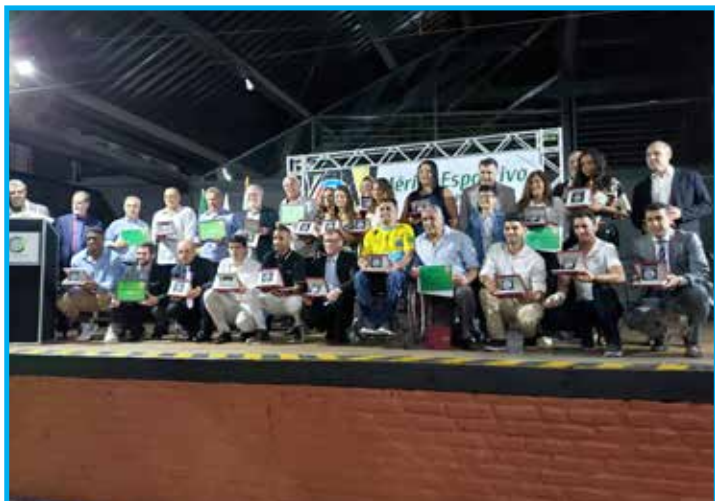
Homenageados da temporada 2019 no Mérito Esportivo Panathlon

Foram também entregues certificados de agradecimento aos apoiadores AMPAR, Aurora JOTAHA, Cervejaria Golem, Estojos Baldi, Gráfica América, Grupo Rezato, Superfeiros, Zé Kodak, AABB, Fátima Buffet e Clube Bom Pastor.