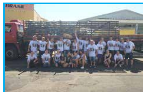
Entrega dos presentes no Dia da Criança