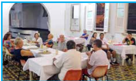
Convívio do mês de setembro na comemoração de 41 anos de fundação