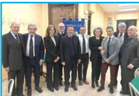
Eleição da nova diretoria do Panathlon Club Torino Olímpica – Itália