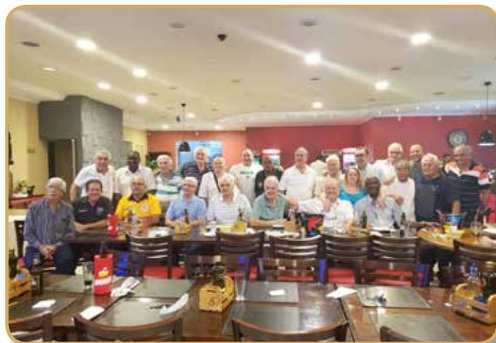
Parte dos panathletas posou para foto no convívio de outubro