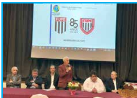
Convívio de setembro na comemoração de 85 anos da FUPE

Ainda em dezembro foi realizada a confraternização no Restaurante Patêo da Luz, na avenida Paulista. Um convívio de Natal diferenciado, com um almoço no dia 21, em uma reunião descontraída, sem pauta e nem discursos, apenas bate-papo com o tradicional amigo secreto e a comemoração com os aniversariantes do mês.