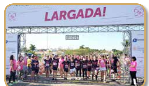
Momento da largada da caminhada de 3 Km